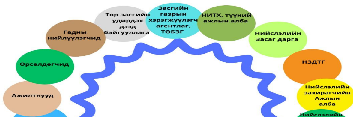
Зураг 1. НИЙСЛЭЛИЙН ӨМЧИЙН ХАРИЛЦААНЫ ГАЗРЫН ҮЙЛ АЖИЛЛАГААНД ХОЛБОГДОГЧ ТАЛУУД